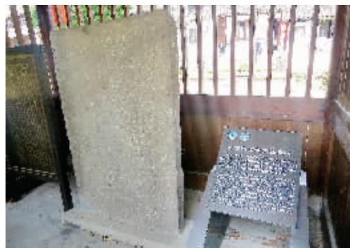
新老两坝示禁勒索碑