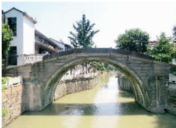
长安闸遗产展示馆门前虹桥