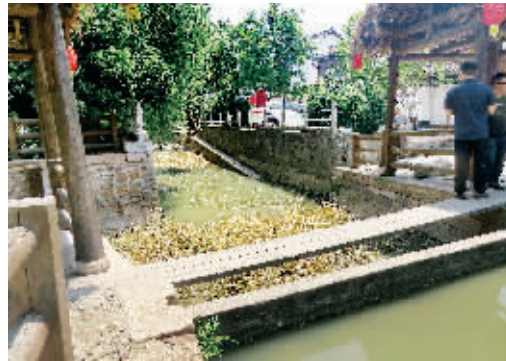
目前仍在发挥水位调节作用的长安坝遗址