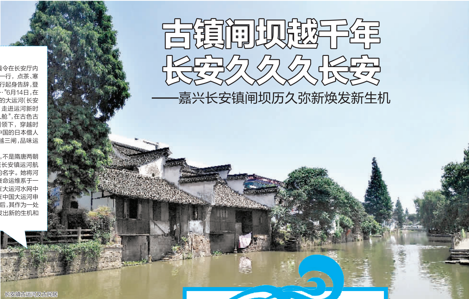
长安镇古运河及民居

“未时(午后),盐官县令在长安厅内热情地接待了成寻一行,点茶、寒暄。申时,成寻一行起身告辞,登船,穿越长安闸……”6月14日,在嘉兴海宁长安镇上的大运河(长安闸)遗产展示馆,“走进运河新时代”采访团“登船入舱”,在古色古香的特效影片的引领下,穿越时空,追随宋代到访中国的日本僧人成寻一行过虹桥,越三闸,品味运河长安风情。 这里的“长安”,不是隋唐两朝的首都,而是嘉兴长安镇运河航道、镇、闸、坝共同的名字。她将河道、镇、闸、坝的兴衰命运维系于一身,记载下“长安”在大运河水网中的重要历史,以及在中国大运河申遗过程及申遗成功后,其作为一处重要遗产点,正焕发出新的生机和担当起新的使命。