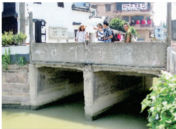
采访团记者在长安闸遗址探访古闸遗存