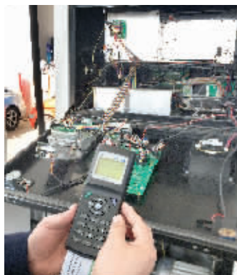
通过检定发现该加油机已启动防作弊功能

测试人员随后通过刻度读数发现,此次加油的误差为万分之四。“在允许误差范围内。”测试人员介绍,可以看出,即使加油枪断断续续加油,也不会造成计量不准的情况。