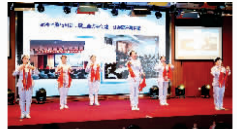
医院的春晚节目精彩纷呈