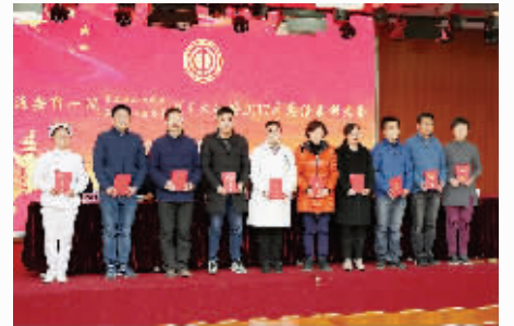
医院优秀管理项目获奖科室代表合影