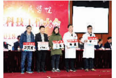
五位职工喜获国家自然科学基金项目

2月8日至9日的下午,淮安市第一人民医院胜利召开五届二次职工代表、七届二次工会会员代表和2017年度总结表彰大会及科技工作大会。