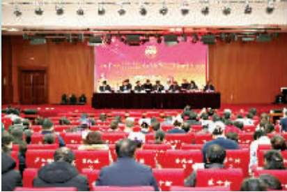
淮安市一院 2017 年度总结表彰大会现场