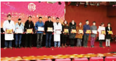
文明科室代表合影