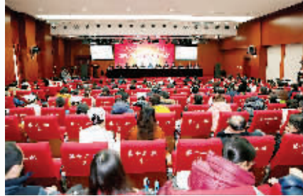
淮安市一院科技大会现场