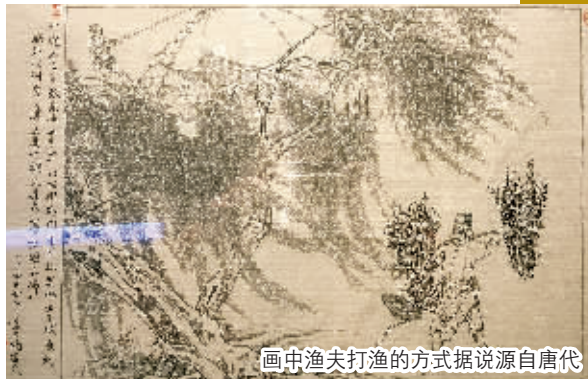
画中渔夫打渔的方式据说源自唐代