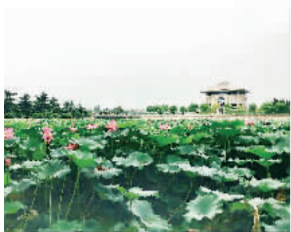
夏日的周恩来纪念馆