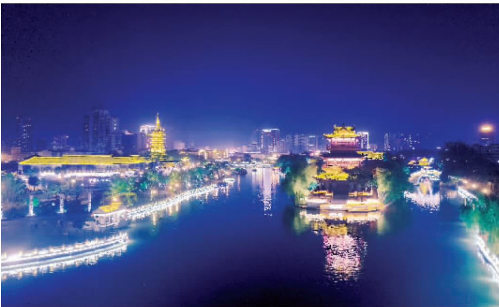
里运河夜景