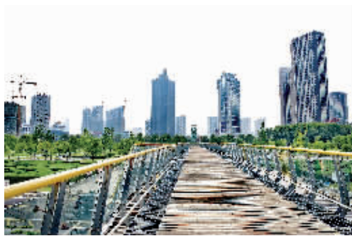
城市新貌