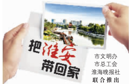
市文明办 市总工会 淮海晚报社 联合推出

里运河绚丽的夜景,钵池山优美的风光,万达商圈的繁华景象……这两天,热心的市民们动起来了,拍起来了,一大波图片已经投到了“把淮安带回家”组委会邮箱。淮海晚报记者梳理发现,虽然大家拍摄的对象不同,时间地点不一,但呈现的都是淮安的美景、美颜和美好。