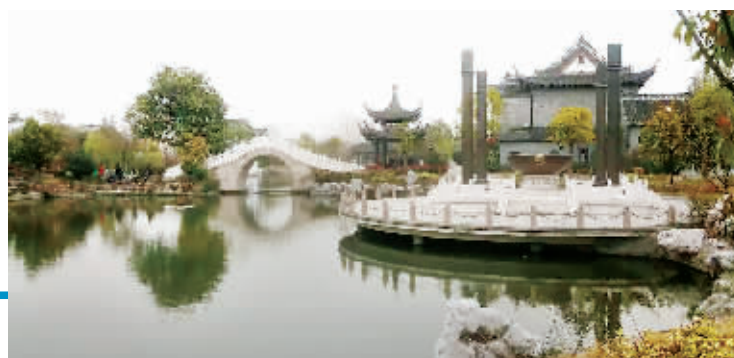
淮安府衙后花园