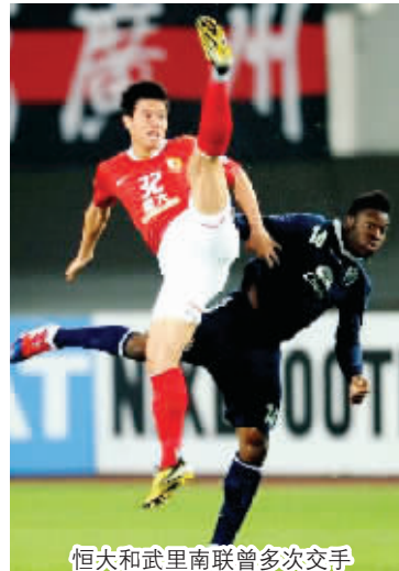
恒大和武里南联曾多次交手

日本联赛冠军川崎前锋落位F1,同组包括了韩国足协杯冠军蔚山现代,澳大利亚联赛“双料”亚军墨尔本胜利,上港若通过附加赛也将进入该组。