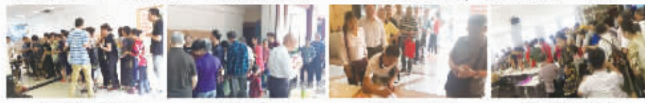
温州火爆活动现场