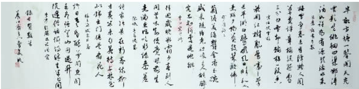
作品名称:《录古贤教首》 作品尺寸:38cm×138cm

男1971年生;江苏淮安经济技术开发区人。江苏省书协会员,淮安市书协会员,开发区书协常务理事。