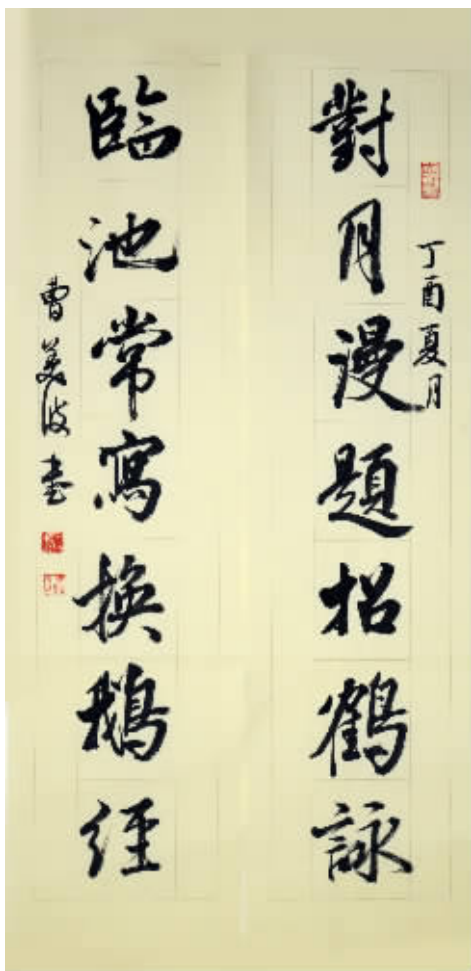
作品名称:《对月 临池》联 作品尺寸:26cm×100cm×2