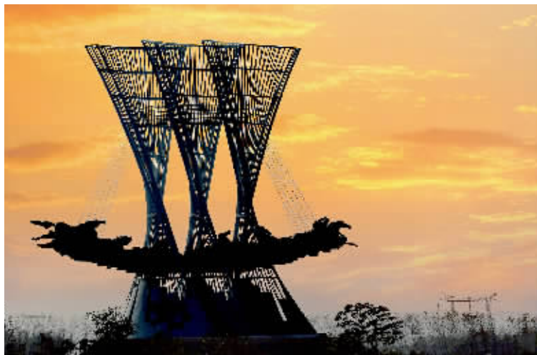
南船北马古淮安

孩童和老年,是人生的两端。美好的孩童时期已然逝去,那么到了老年,就让我们做一个老孩童吧,度过一个孩童般自由、率真而无忧虑的老年时代。