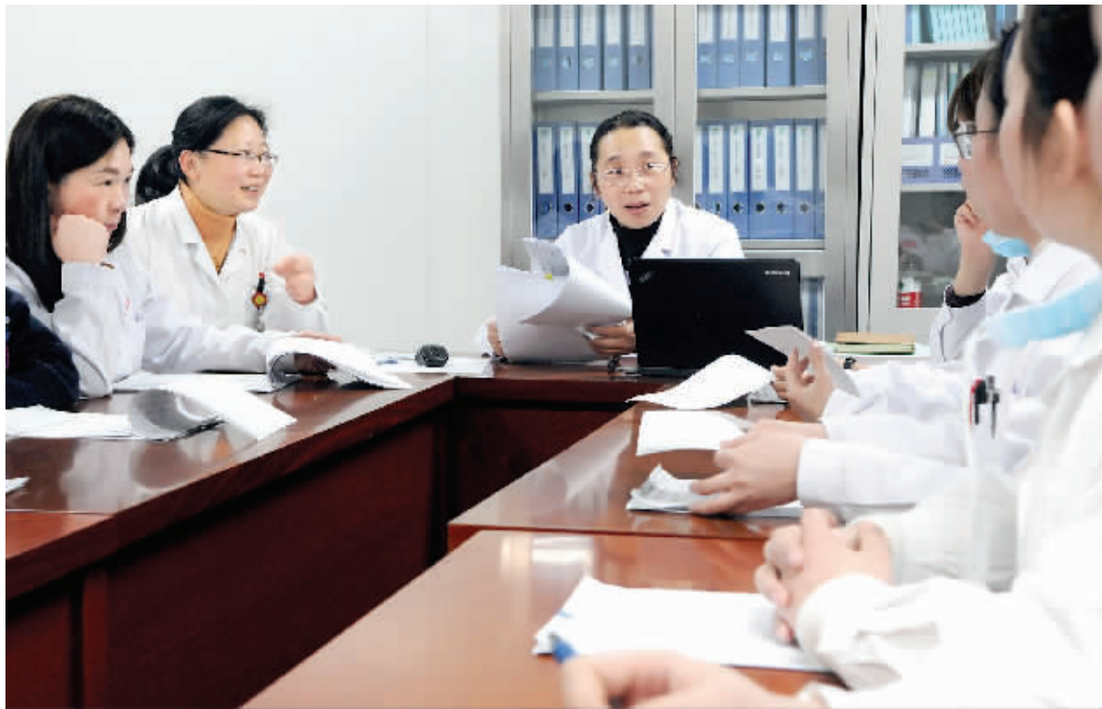
加强团队建设,进行课题讨论