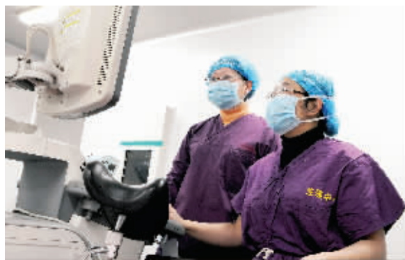
她在全神贯注地手术