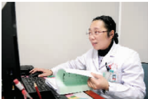
她刻苦钻研,善于总结,撰写了20多篇医学论文