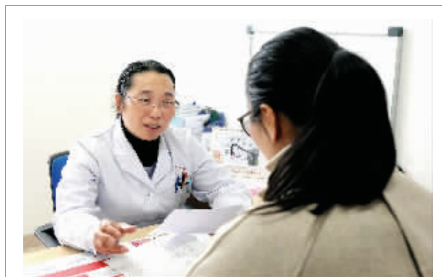
她深深理解只有通过提高医疗质量和服务水平,才能赢得患者的信任