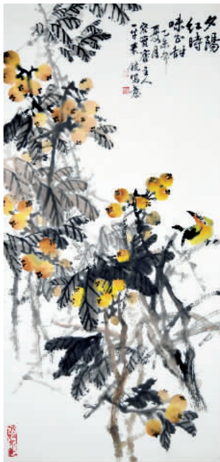
夕阳红时味正甜 秦镜