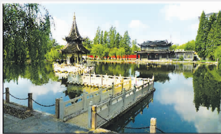
夏日清晏园