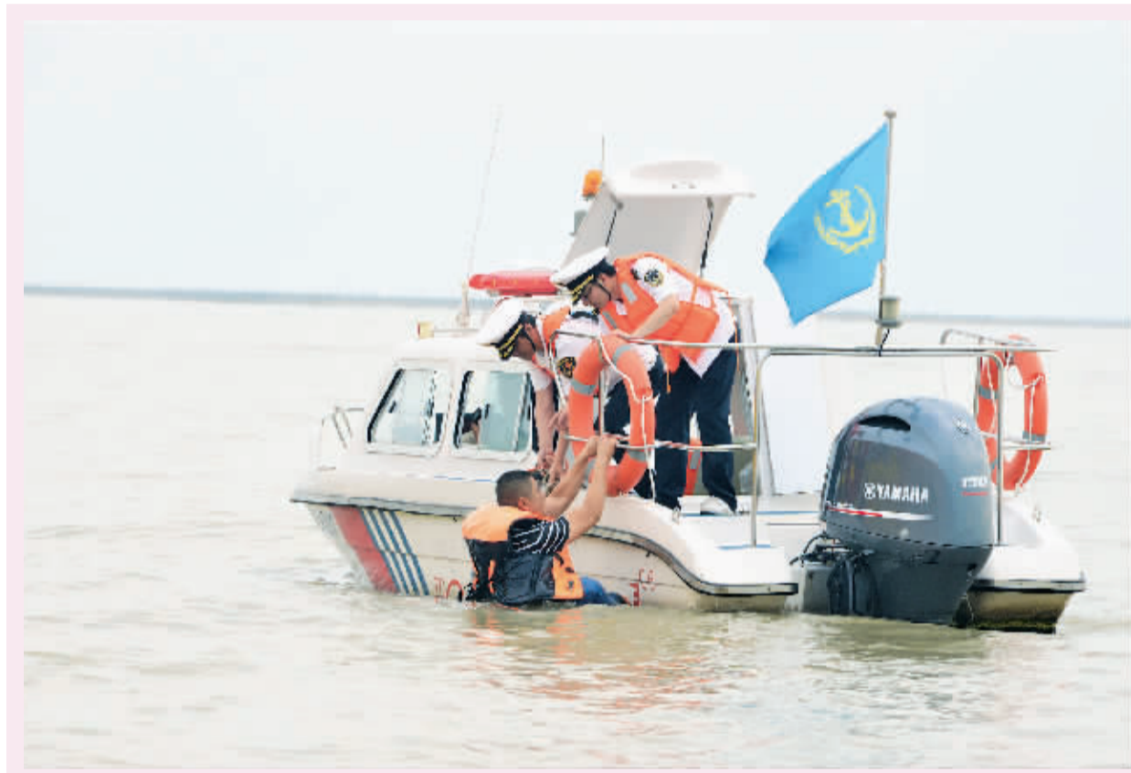
6月27日，洪泽区地方海事处联合洪泽湖旅游度假村有限公司、洪泽湖客运旅游有限责任公司、洪泽湖古渔村生态旅游有限公司在洪泽湖南线航道5号标水域举行了“2018年洪泽湖旅游船舶水上消防救生联合演习”。

本次演习包含旅游船消防灭火和人员落水救生两个科目，共出动船艇6艘、参演人员30余人。演习有效增强了企业和船员的安全生产意识。