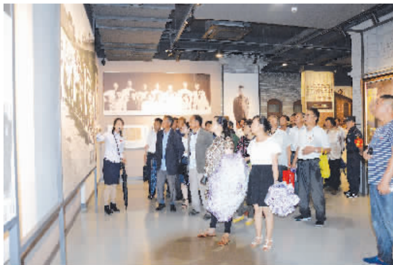
7月6日，岔河镇滨河村党总支组织全村58名党员干部前往周恩来纪念馆参观学习，缅怀周总理伟大的一生。 李文俊 赵长宏

咬定民生实事，打造一个产业兴旺、生活富裕的和谐小镇，全面增强幸福感。咬定富民产业：做实渔网具产业，渔网具产业是蒋坝一项富民产业，年人均可增收1200元，尽快落实渔网具产业园项目，把传统的渔网具产业与旅游产品有机结合起来，实施富民项目，实现人均年纯收入突破20000元大关。咬定惠民产业：做靓乡村民俗，积极鼓励在外创业的有识之士回乡创业，打造一批极具蒋坝特色的乡村民俗惠民产业。咬定经济产业：做特观光农业，加快推进总投资6000万元重农农庄生态园项目，该项目共占地140.96亩，分设花卉景观区、果树采摘区、珍禽园、动物园观赏区、亲子乐园体验区，通过经济产业带动就业，增加农民收入。