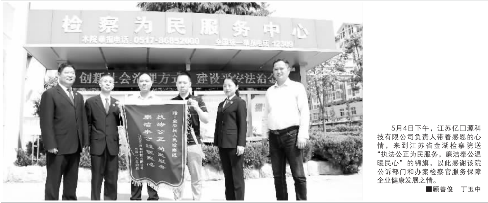
5月4日下午，江苏亿口源科技有限公司负责人带着感恩的心情，来到江苏省金湖检察院送“执法公正为民服务，廉洁奉公温暖民心”的锦旗，以此感谢该院公诉部门和办案检察官服务保障企业健康发展之情。

上述司法建议是针对不特定主体，没有具体的个人或单位送达，法庭便在辖区96个村居人民委员会公示栏、各镇集镇宣传栏、鱼塘集中的交通路口进行张贴。这是金湖县人民法院发出的第一份针对没有特定主体的司法建议。