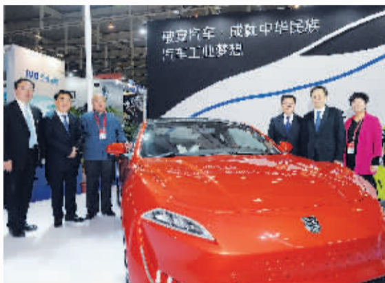
国台办和省市领导在敏安电动汽车展区调研