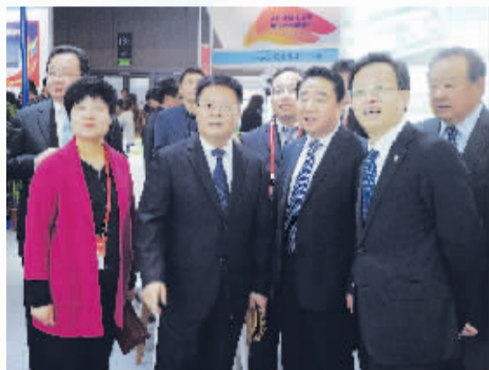
国台办和省市领导在实联集团展区调研

我市作为江苏台资集聚新高地,共组织江苏敏安电动汽车有限公司、实联集团、全稳农牧科技集团等9家在淮台企参展,集中展示近年来台企发展及淮台经贸合作的成果。参展期间,国台办、海协会和省委、省政府领导亲临淮安展厅,对在淮台企发展成果给予高度赞赏,淮安台资集聚新高地的品牌进一步打响。