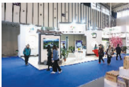
全稳农牧科技集团展区