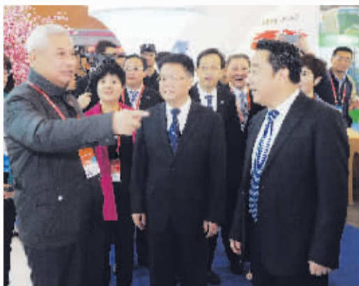
国台办和省市领导在全稳农牧科技展区调研