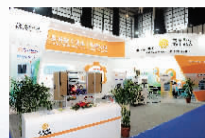
大量科技(涟水)有限公司展区