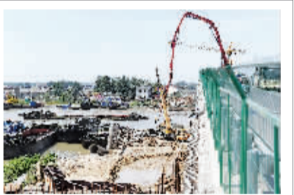
昨日,在黄码大桥施工现场,工人正在抓紧浇筑混凝土。继去年底黄码大桥北半幅建成通车后,南半幅建设工程也正式启动。据了解,京杭运河黄码大桥是连接淮安区与清浦区的重要通道,建成后将进一步改善京杭运河通航条件,方便两岸群众出行。