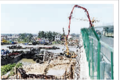
昨日,在黄码大桥施工现场,工人正在抓紧浇筑混凝土。继去年底黄码大桥北半幅建成通车后,南半幅建设工程也正式启动。据了解,京杭运河黄码大桥是连接淮安区与清浦区的重要通道,建成后将进一步改善京杭运河通航条件,方便两岸群众出行。 ■记者 管伟法