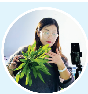
昨日,在淮阴区一水草种植基地,工作人员正在整理、销售水草。连日来,该基地水草迎来销售旺季,工作人员忙着整理、包装水草,供应市场。