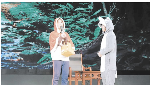
剧本演绎《Little Red Riding Hood》