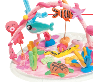
四(5)班 潘馨瑶 指导老师:周红叶 作品名称:《海洋乐园》 作品描述:海洋里热闹非凡,大海龟缓慢地游着,花园鳗蹿来蹿去,小丑鱼和章鱼玩着游戏,大鲸鱼头上还喷着水花呢!