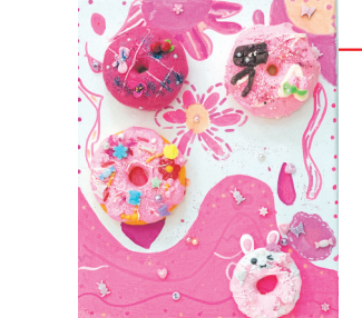
五(3)班 丁子祺 指导老师:陈朋 作品名称:《粉红珊瑚海》 作品描述:粉色的珊瑚、甜美的泡泡、粉红的海水,摆上超轻黏土制作的精致甜甜圈,就是治愈的、粉红色的珊瑚海。