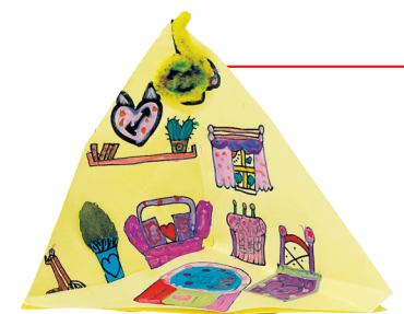
四(8)班 丁妙妍 指导老师:朱丹 作品名称:《漂亮的房间》 作品描述:我为房间设计了一张紫色的小沙发和一个小书架,还有一张漂亮的大地毯,我喜欢这个温暖的小卧室。