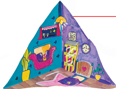
四(8)班 韩君玮 指导老师:朱丹 作品名称:《我的小房间》 作品描述:想知道我的房间是什么样子的吗?瞧,沙发、书柜、挂钟、床、绿植、吊灯……都被我画了进去,希望大家喜欢这幅作品。