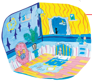
四(8)班 唐诗语 指导老师:朱丹 作品名称:《温馨的房间》 作品描述:我有一个快乐的小天地,那就是我的小卧室,我可以在里面读书、写字、玩耍,还可以伴着蓝色的星星入睡。