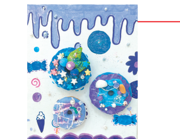
五(3)班 汪轩羽 指导老师:陈朋 作品名称:《蓝色的“美味”》 作品描述:甜甜圈又称多拿滋、唐纳滋,是一种十分美味的食物,蓝紫色的甜甜圈看起来软糯饱满,让我们沉浸在美味之中。