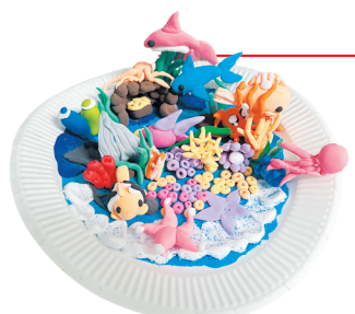
四(7)班 郭玥辰 指导老师:周红叶 作品名称:《闪闪亮的海洋》 作品描述:神奇的海洋里都有些什么呢?当然有闪闪的细沙、五彩的珊瑚,各种各样的小鱼在水草中间嬉戏……