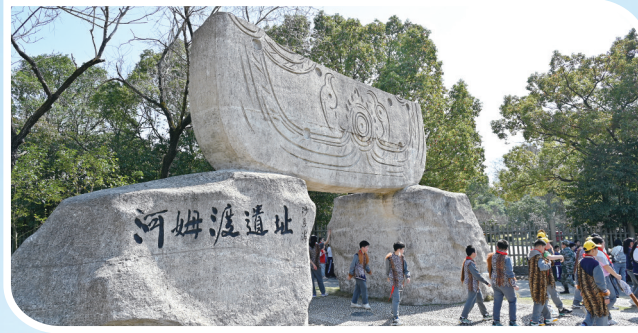
余姚市河姆渡博物馆