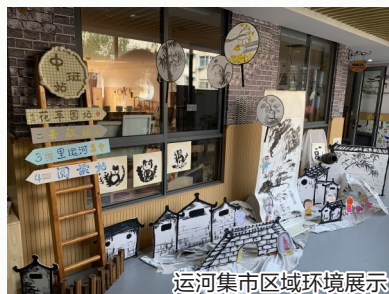
运河集市区域环境展示