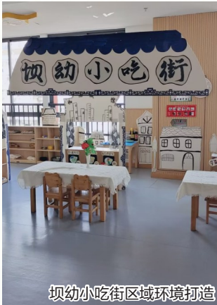
坝幼小吃街区域环境打造