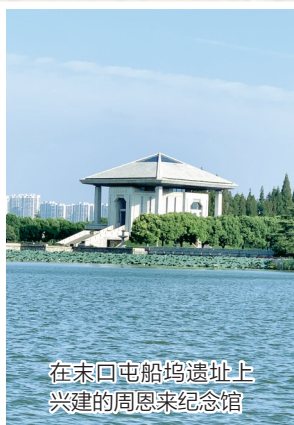
在末口屯船坞遗址上兴建的周恩来纪念馆