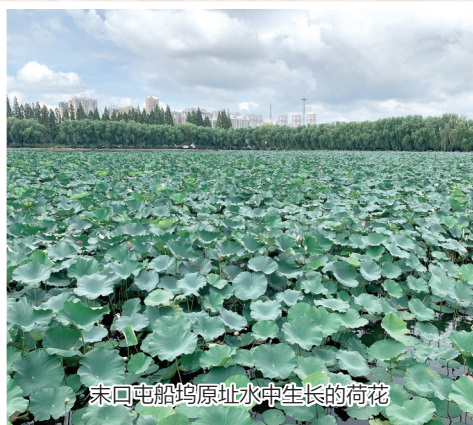
末口屯船坞原址水中生长的荷花