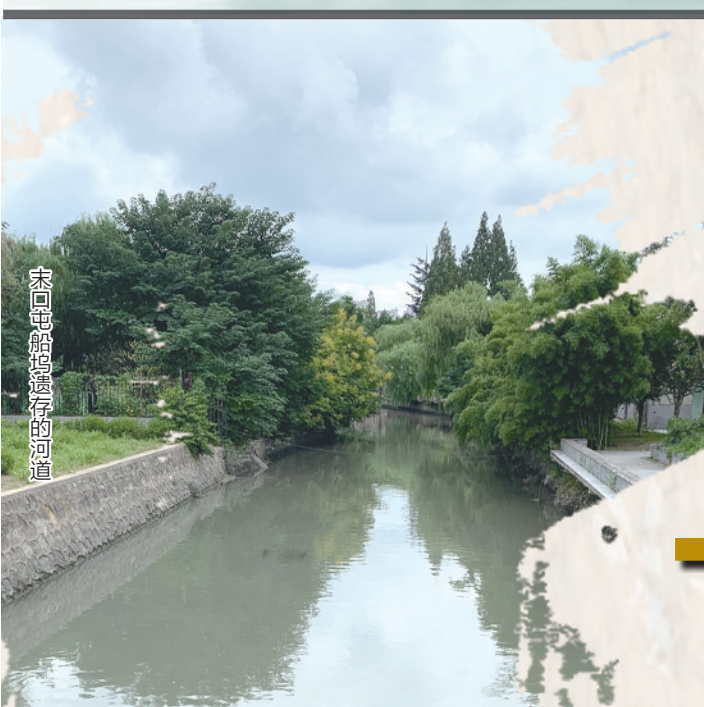
末口屯船坞遗址上的河道