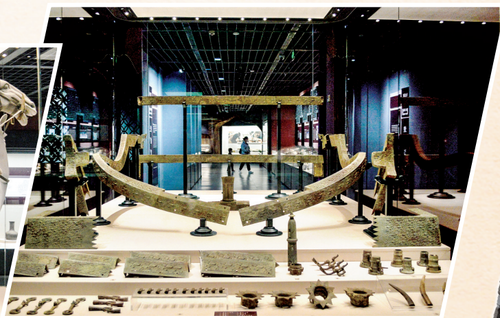
●“镇馆之宝”二: 高庄战国墓车舆铜饰件

运河村战国墓木雕鼓车荟萃了古代车制和青铜、漆绘多种工艺,是淮安悠久历史和灿烂文化的见证,是“南船北马”的重要实物。为展示淮安考古成果,还原馆藏国宝级文物风采,市博物馆对该车构件实施了技术保护与修复,并依据原貌进行复原展出,以飨观众。