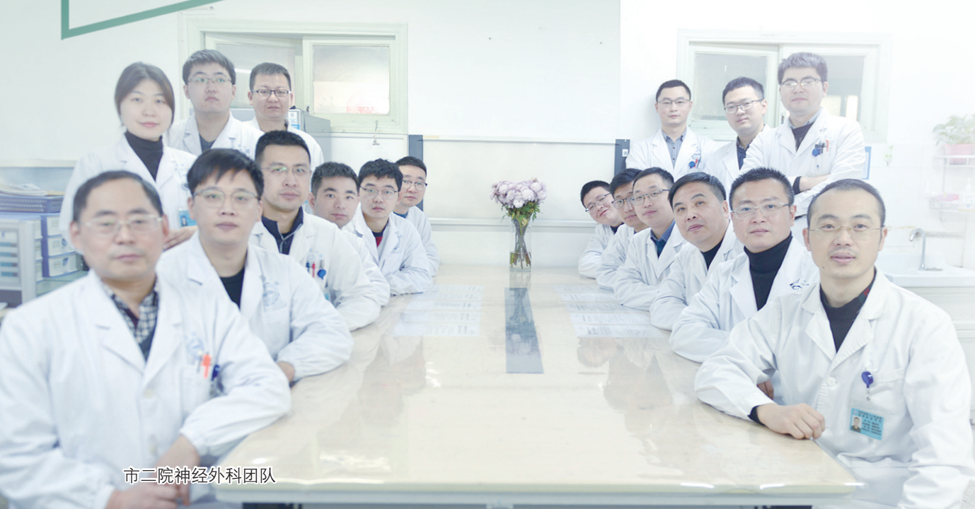
市二院神经外科团队

越是艰险越向前。面对生命的禁区，市二院神经外科团队永葆创新精神和悬壶济世的情怀，不断挑战自我，精研“头等功夫”，守护“生命中枢”，在刀尖上“舞”出一个又一个生命奇迹，为无数家庭带来希望。