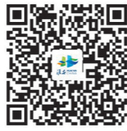
“码上巡察”监督平台 扫描二维码，点击“在线举报”

意见建议，重点是关于违反政治纪律、组织纪律、廉洁纪律、群众纪律、工作纪律、生活纪律和违反中央八项规定精神等方面的举报和反映。其他不属于巡察受理范围的信访问题，将按规定移交有关单位认真处理。