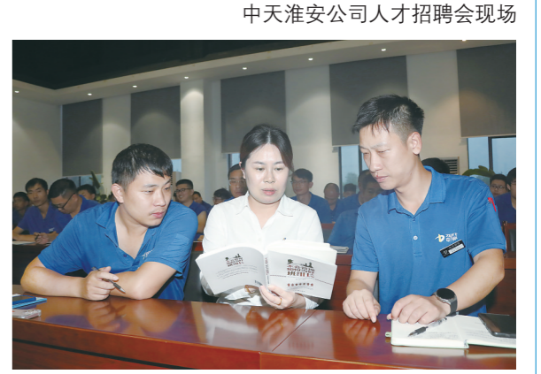
中天淮安公司人力资源处业务培训

今年9月，中天淮安公司启动新一轮见习主管、见习技术助理岗位公开招聘工作，打通人才职业发展通道，让一批有理想、敢担当、能吃苦、肯奋斗的年轻人尽快走上管理岗位。 员工成长成才通道畅通，是企业留住人才、提升竞争力的关键。在实现企业效益最大化的同时，实现个人价值最大化。公司制定人才相关管理办法，完善激励政策，结合中天钢铁集团“三通道”成长路径，通过轮岗、见习等途径，搭建员工向上发展的阶梯。构建薪资体系，保证基层员工工资稳定并高于地区平均工资水平，确保企业待遇公平公正。积极帮助生活困难的员工，体现关爱包容的企业文化。在政府部门的支持下，为专业技术人才申请协调人才公寓、子女入学等事宜，积极开展相关高端人才项目申报、职称申报，多方保障员工权益，让员工留在中天、干在中天、爱在中天。