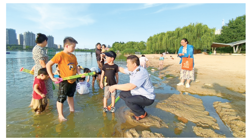
连日来，不少市民带着孩子在钵池山公园人造沙滩消暑休闲。为保障游客安全，该公园在深水处安装护栏，在岸边设置警示标志，并安排专职安保人员24小时值守和巡逻。图为安保人员向孩子们普及防溺水知识。■融媒体记者 王昊