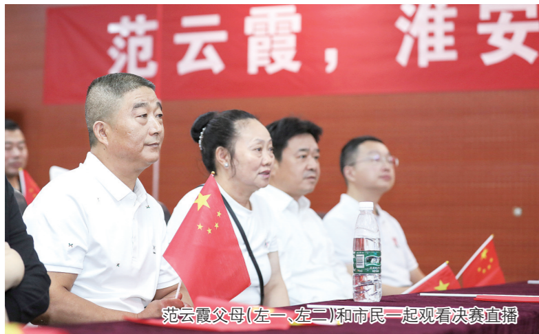
范云霞父母(左一、左二)和市民一起观看决赛直播