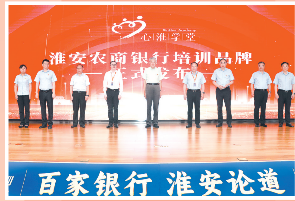
淮安农商行“心淮学堂”培训品牌发布