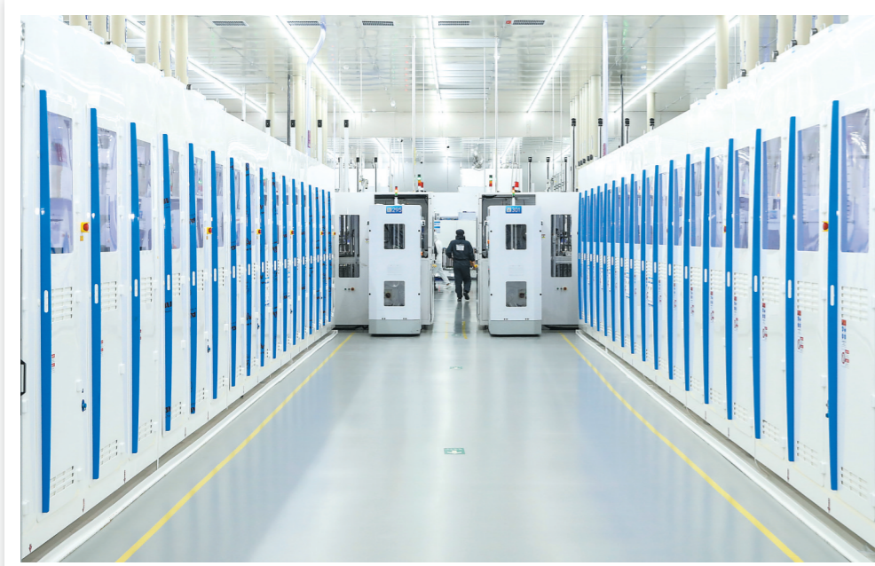
高效太阳能电池片生产忙

效用地，把有限的资源放到优质项目上，不断提高发展的质量和效益。要把“做的要比说的好、服务要比需求早”理念落到实处，完善项目全生命周期服务保障机制，及时高效解决企业运行、项目推进中遇到的具体问题，切实以优质服务保障企业发展、项目顺利建设。要坚持管发展必须管环保、管生产必须管安全，深入开展安全隐患排查整治，把安全生产和生态环保的要求贯穿项目建设和生产经营全过程、各方面，以整体治理体系和能力提升推进安全环保各项工作整体提升。