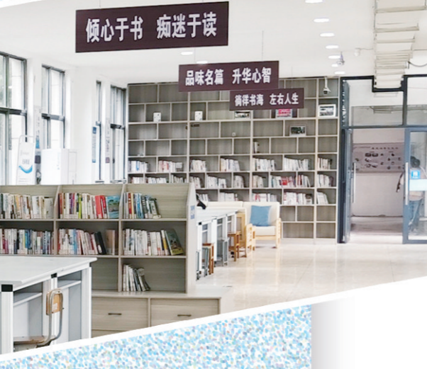
倾心于书 痴迷于读