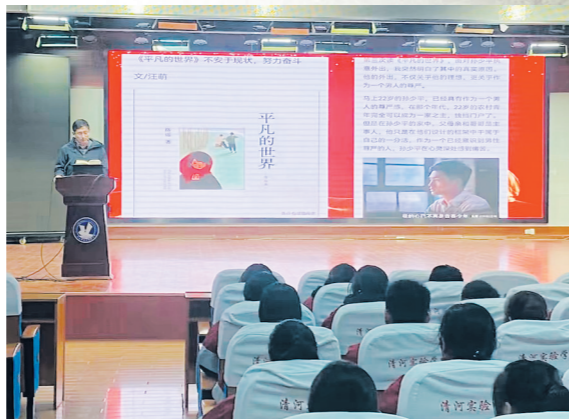
学校举行阅读专题讲座

学校环境优美、设施一流、师资雄厚，先后获得江苏省实施教育现代化工程示范初中、江苏省和谐校园、江苏省平安校园、淮安市书香校园等荣誉。现有省优秀班主任2人，市基础教育专家组成员1人，市优秀教师工作者、优秀教师11人，区首席教师9人，区学科带头人6人，区骨干教师、教学能手16人，交流引进骨干教师40余人。