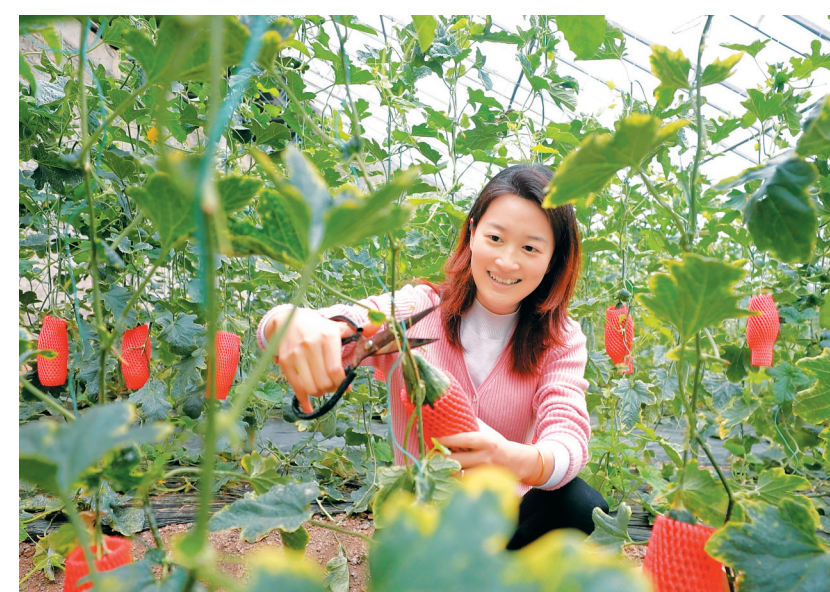
日前，淮阴区种植大棚里的甜瓜进入成熟期，吸引市民前往采摘、选购。

年汛期前，将实施纬三河下段工程，通过开挖河道、建设生态护坡等方式，有效解决卫生大厦片区2.5万平方米土地内涝问题。