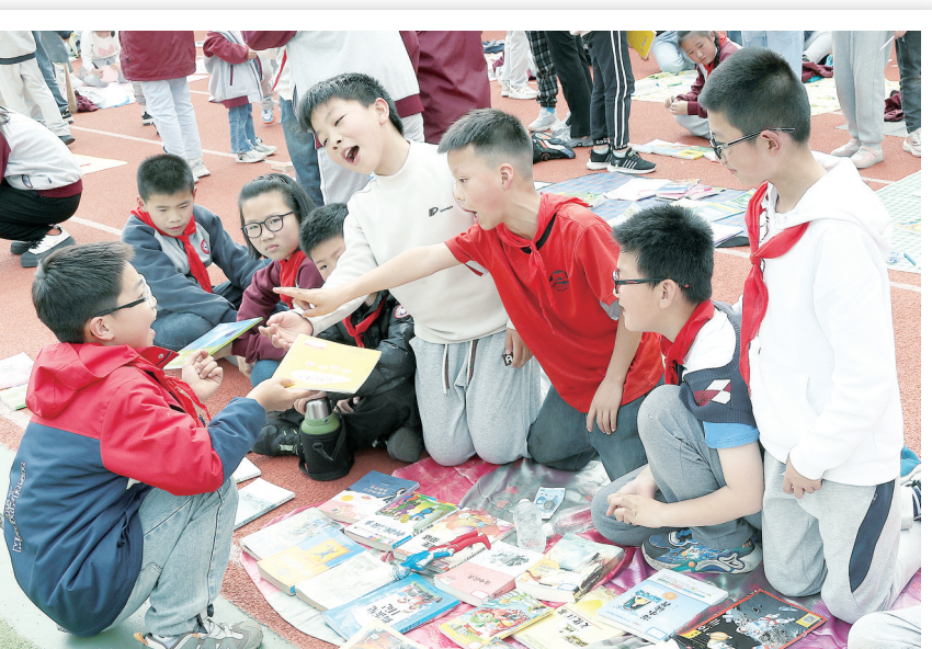
为迎接世界读书日的到来，连日来，我市各地开展丰富多彩的活动，推进全民阅读，营造文明风尚。左图：4月22日，淮阴区淮高镇举办读书交流分享会，志愿者与小读者一起读书，享受阅读时光。右图：4月22日，我市一小学举办校园跳蚤书市，学生通过以物换物等方式将闲置书籍循环利用，共享资源，以书会友。