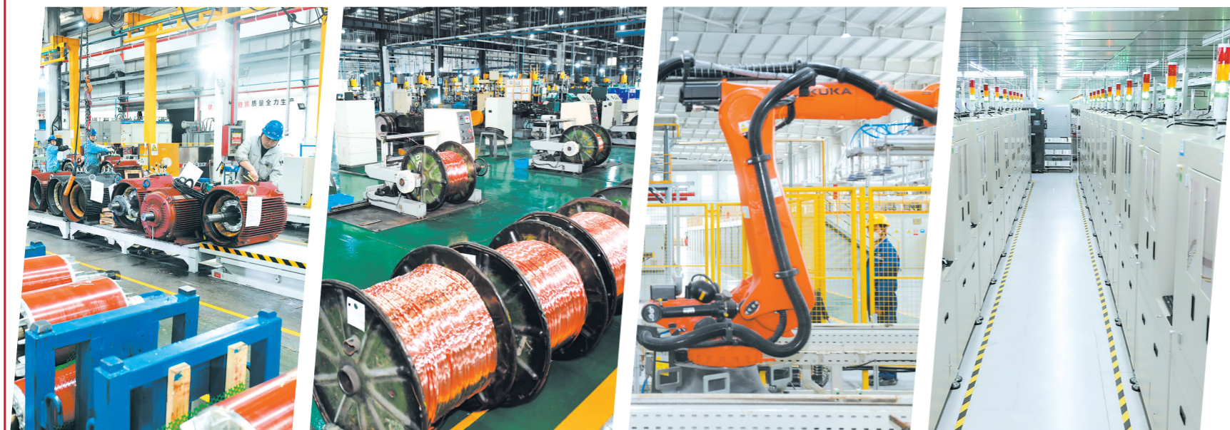
卧龙电气淮安清江电机有限公司绿色智能化工程技术改造项目