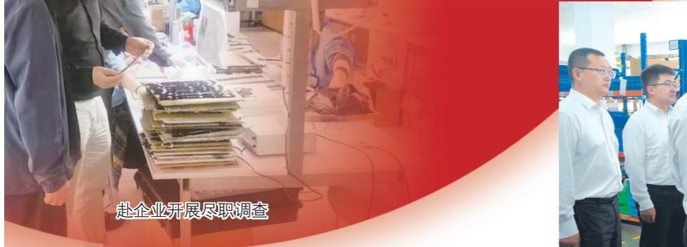
赴企业开展尽职调查