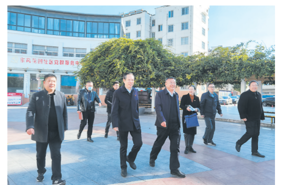
走进社区开展结对帮扶

落地提供助力。另一方面,积极吸纳县区入股,全面提升核心竞争力。充分利用项目实施的契机,通过吸引县区入股,共同打造服务实体经济平台,增强综合服务实力。融资担保集团注册资本由原来的26.216亿元增至30.216亿元,主体信用评级由原来的AA提升到AA+,进一步扩大了融资担保规模,为中小微企业融资担保提供强有力的服务支撑。