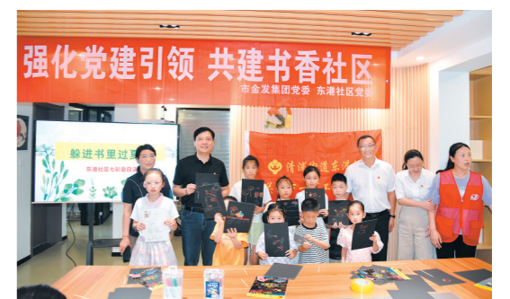
开展书香社区建设

坚持主动担当的恒心,增强企业发展的信心,持续扩大金融服务规模,提升服务质效,进一步缓解淮安本地实体经济融资难、融资贵问题,助推我市营商环境优化升级,切实把主题教育成果转化为办实事、解民忧、促发展的实际行动,持续推动党的建设与金融服务、产业投资主责主业深度融合、相互促进,确保集团高质量发展取得新进展、新成效。