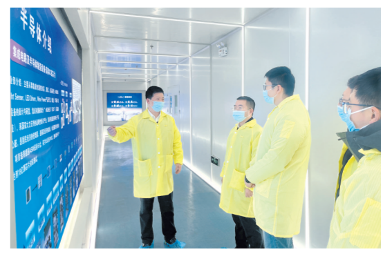
赴半导体企业观摩学习

经济社会发展贡献金发力量。乘风破浪潮头立,扬帆起航正当时。2024年,金发集团将持续放大规模优势、渠道优势、信息优势,不断提升各金融板块专业化服务水平,充分发挥协同优势,围绕“打造国有资本金融板块的承接主体、地区金融服务与产业投资平台”发展定位,对照服务实体经济、防控金融风险、深化金融改革三大任务要求,把未来发展放到全市发展大局的“大坐标”中去谋划定位,力争成为牌照丰富、资源协同、业务联动、管理规范、对区域发展有较大影响力的省内一流金融集团。