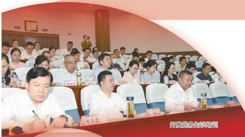
开展党务知识培训

金融是现代经济的核心,是国民经济的血脉,是国家核心竞争力的重要组成部分。习近平总书记指出:“金融活,经济活;金融稳,经济稳。经济兴,金融兴;经济强,金融强。经济是肌体,金融是血脉,两者共生共荣。”近年来,淮安市金融发展集团有限公司(以下简称“金发集团”)在实干中逐渐发展壮大,在创新中行稳致远,一步一个脚印谋发展,服务地方经济建设大局,在淮安经济社会高质量发展的道路上迈出坚定步伐。