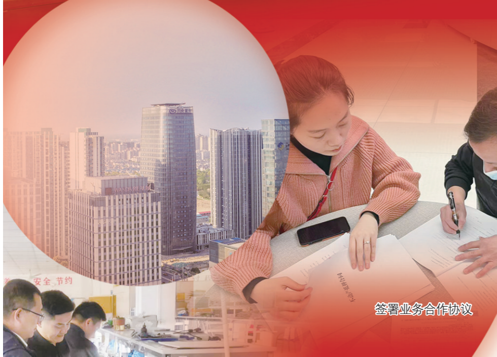
签署业务合作协议