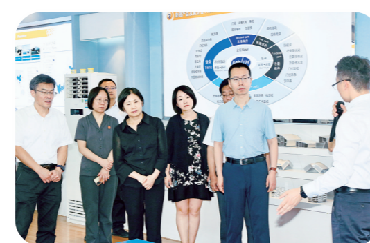
最高人民法院台办主任邱鹏调研淮安经开区法院涉台纠纷调处工作