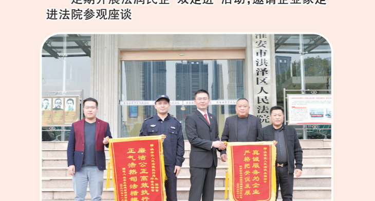
定期开展法润民企“双走进”活动,邀请企业家走进法院参观座谈