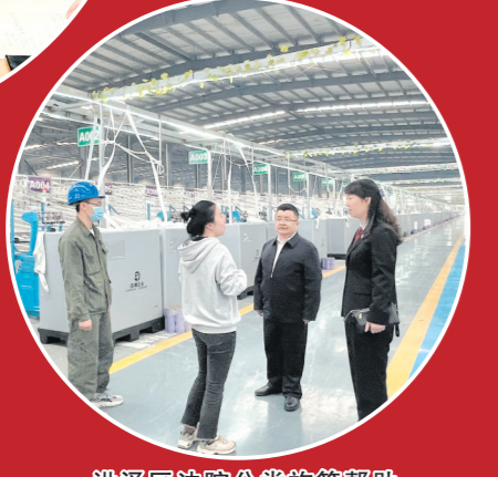
洪泽区人民法院分线庭前帮助经营困难企业“破茧重生”