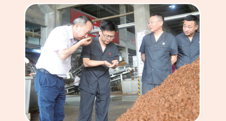
走访重大项目南高齿,为企业提供“点单式”司法服务