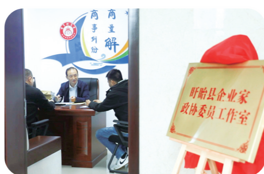
邀请商会调解员参与商事纠纷调解