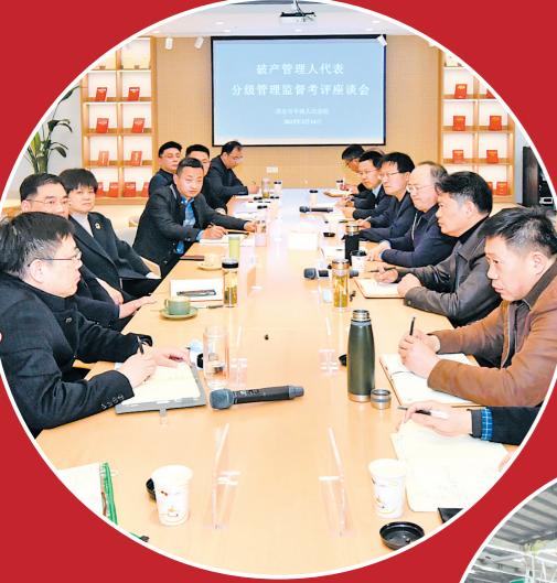
与破产管理人座谈交流,完善履职监督和评价机制