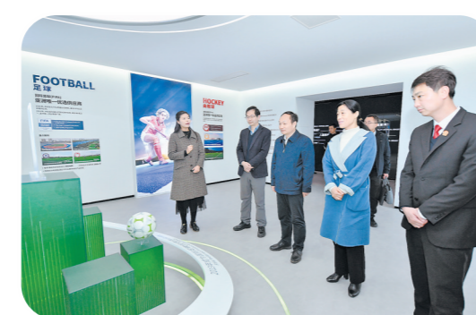
深入企业走访调研,助力知识产权保护

洪泽区法院积极践行法治化营商环境建设,持续深化破产审判改革,创新破产财产处置方式,突破土地瓶颈制约,为重大项目落地提供强有力的司法保障。该案是洪泽区法院积极服务经济社会高质量发展,实施破产审判助招商的“破局”战略的体现,也是洪泽区法院联动同步推进“闲置土地清理、僵尸企业盘活、知名企业引进”的又一创新尝试。