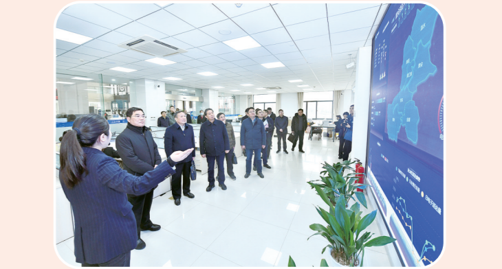
主动对接重点企业,了解司法需求,提供精准服务

大运河百里画廊作为淮安大运河文化带建设的标志性工程,是淮安贯彻落实大运河文化带建设相关精神,打造大运河文化带标志性城市的重点建设项目。本案审理关乎大运河百里画廊项目能否有序推进。承办法官从案件表象中“抽丝剥茧”找准矛盾根源,从诸多材料中梳理事件的“来龙去脉”,依法高效审理案涉纠纷,作出示范性判决,达到以个案集中化解涉众纠纷的效果,为项目顺利推进提供了有力司法保障,实现了维护当事人合法权益与推进重大项目建设并重的目标。