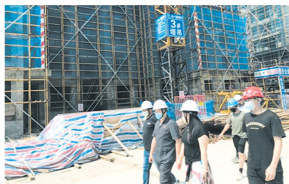
实地推进小区建设项目破产重整案件处置