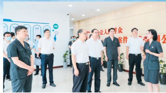
省高院调研盱眙企业服务中心