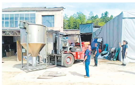
执行干警前往浙江省湖州市执行企业机械设备