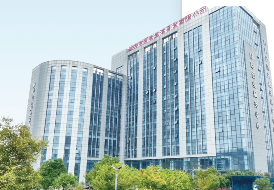
盱眙企业服务中心

“在实施‘法商e家’工程中，盱眙县法院以能动司法把‘冷冰冰’的法律执行得‘热腾腾’，以府院联动‘暖服务’营造出企业发展‘热环境’，有力彰显了优化法治化营商环境的法院担当。”全国人大代表李叶红表示。