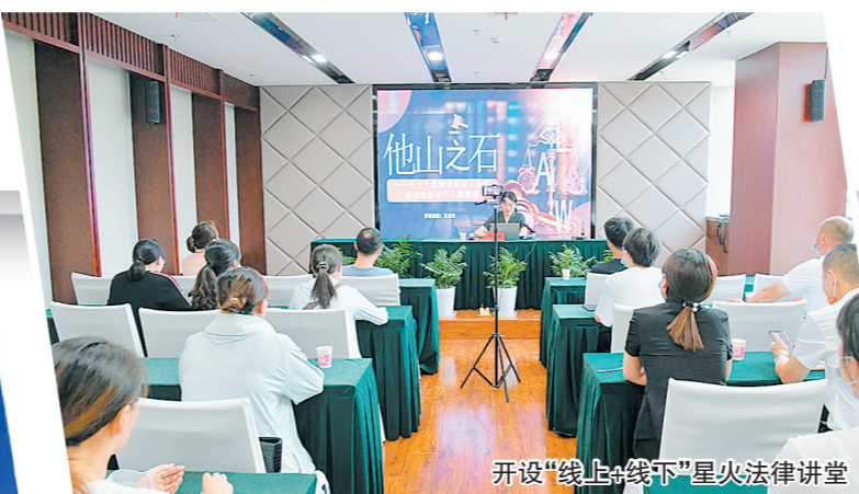
开设“线上+线下”星火法律讲堂