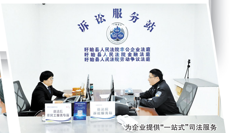
为企业提供“一站式”司法服务