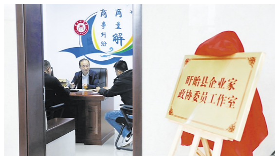
为企业提供法律服务