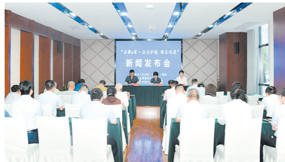
召开“法商e家·法治护航 银企共进”新闻发布会