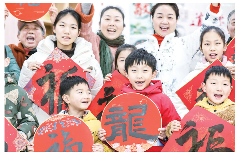
2023年12月30日，淮安日报社“党报记者进社区 服务民生零距离”专项行动走进清江浦区花街社区。活动组织各行各业的志愿者为社区居民提供健康检查、法律咨询等志愿服务，并送上新年祝福。 ■融媒体记者 赵启瑞

市住建局相关负责人介绍，我市将继续立足乡村发展实际，整合资源要素，鼓励有条件的村、镇、县加大省级特色田园乡村创建点的密度，持续深入推进特色田园乡村创建“串点连线成片”，打造更多高品质的特色田园示范村、示范镇、示范县，集成展现乡村振兴的现实模样。