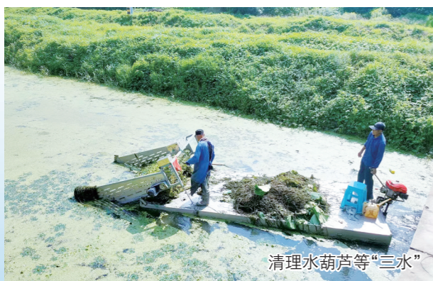
清理水葫芦等“三水”