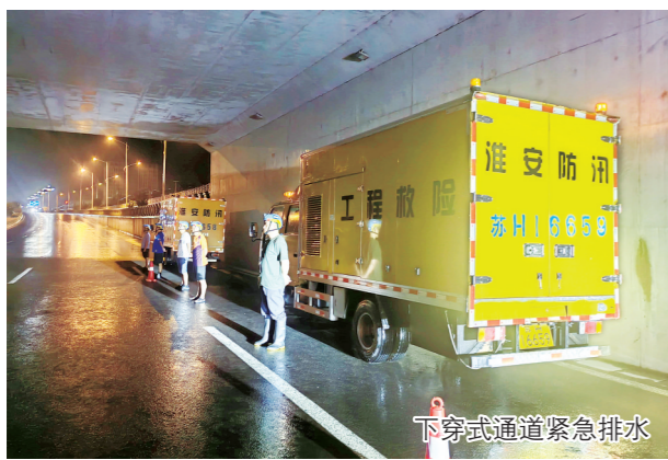
下穿式通道紧急排水