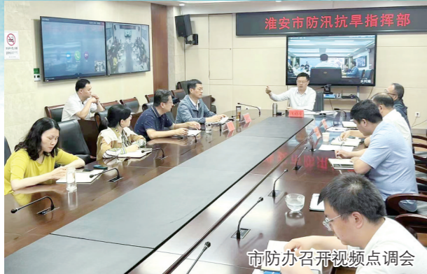
市防办召开视频点调会

兴水利民，永无止境。2024年，全市水利系统将坚决贯彻市委市政府决策部署，聚焦“不淹不涝”城市建设、重大水利工程建设、河湖保护治理等工作重点，实干笃行，攀高比强，为全市高质量跨越发展大局作出更多水利贡献。