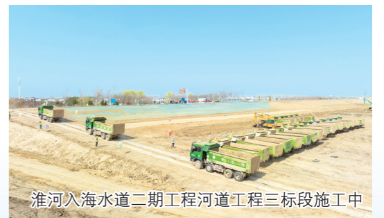
淮入海水道二期工程河道工程三标段施工中

兴水利民，永无止境。2024年，全市水利系统将坚决贯彻市委市政府决策部署，聚焦“不淹不涝”城市建设、重大水利工程建设、河湖保护治理等工作重点，实干笃行，攀高比强，为全市高质量跨越发展大局作出更多水利贡献。