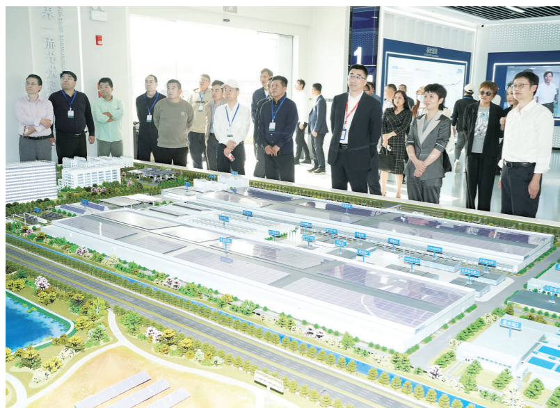
嘉宾参观捷泰新能源科技