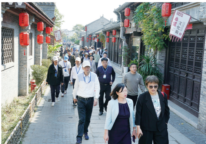
嘉宾参观河下古镇