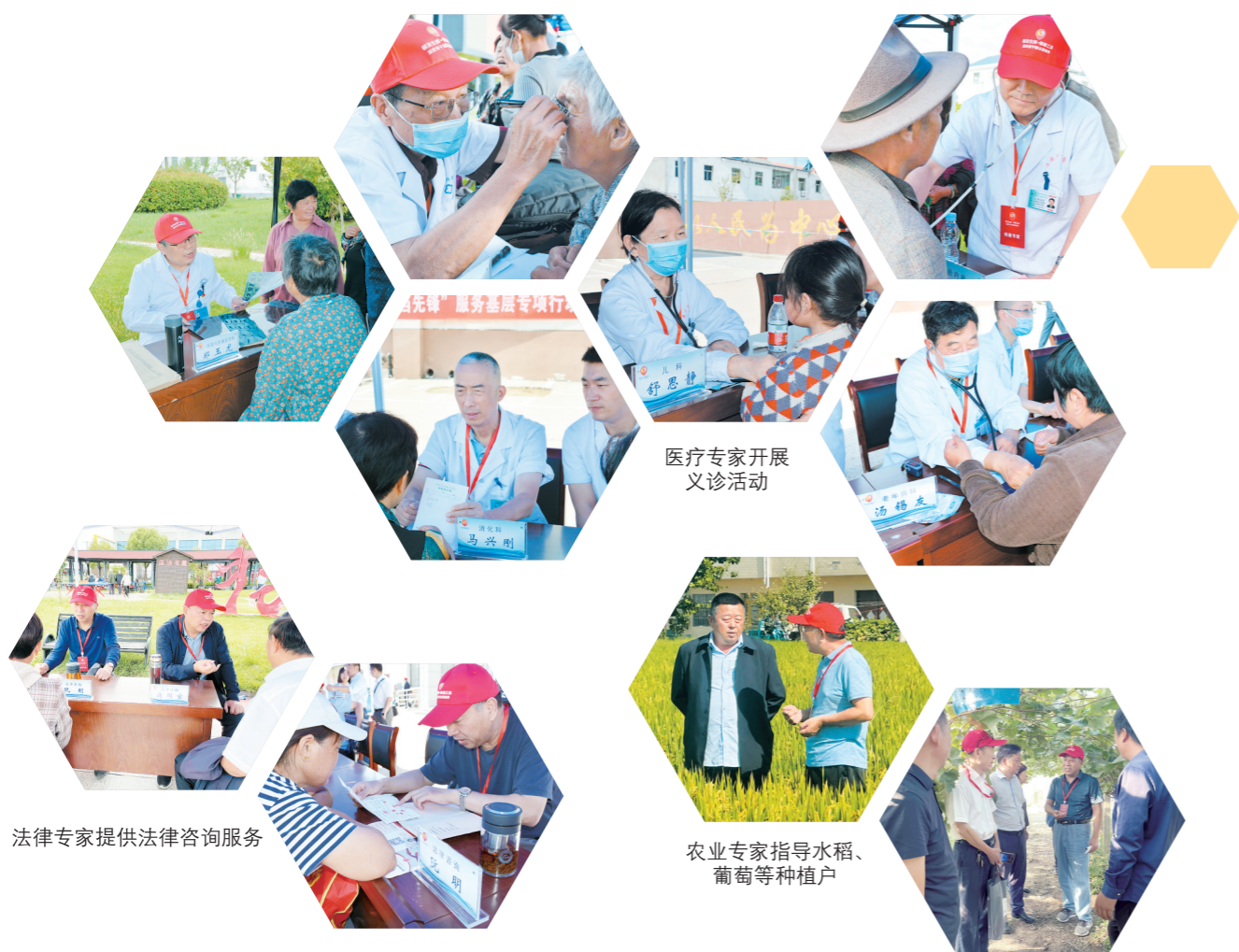
法律专家提供法律咨询