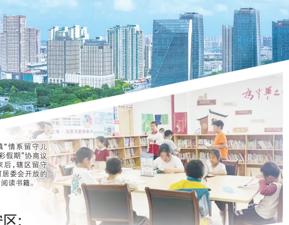
淮安: “码”上反映马上办 解决群众烦心事 顺河镇“情系留守儿童,点亮多彩假期”协商议事活动结束后,辖区留守儿童在农家书屋内阅读书籍。

一条好路子,新滩村村干部代表提出,打造老 子山镇本土温泉旅游企业和文虎水上体育项目是带领农民致富的一个好办法。 经过充分讨论协商,老“山”镇“有事好商量”协商议事室准备近期召开上岸渔民招商招聘会。对外准备邀请一批乡贤能人代表回乡看一看,为他们回乡投资兴业提供信息,争取为协商议事提供更多工作岗位;对内将对通工上岸渔民进行摸底,为老“山”镇现有丰泽工艺品、鞋垫厂等传统产业制造业储备人才;邀请兄弟镇“网红书记”现场进行直播带货、网络销售教学,引导更多渔民从事电子商务、民俗、农家乐等服务。 老“山”镇这场高规格的协商活动,因为相关政策宣传到位,广大渔民参会后思想有很大变化,变不愿上岸为愿意上岸,想上岸、上得了岸;同时通过召开协商议事会讲透上岸的深远意义,让渔民明白“靠水吃水”还有很多新招数,获得渔民一致好评。 在议事过程中“融”出新合力。“码”上议平台与基层社会治理相结合,聚焦“三农”领域,助力解决群众急难愁盼问题。与百姓冷暖紧密相连,