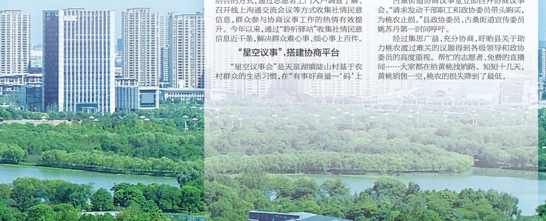
盱眙县: 群众利益无小事 一枝一叶总关情 近年来,盱眙县通过“有事好商量”“码”上议“听民意、办实事、解民忧,拉近与群众距离,提升基层治理效能,助力乡村振兴,走出了一条融合基层社会治理的新路。