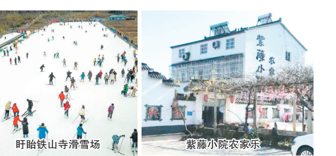
盱眙铁山寺滑雪场

陡山村位于盱眙县西南部,距县城约35公里,毗邻铁山寺旅游度假区,旅游资源丰富。近年来,通过打造特色民宿、农业观光、红色体验、康养度假等旅游产品,初步实现“流连忘返的田园风光、农民致富的产业支撑、特色鲜明的红色文化、配套便利的公共服务”发展目标。陡山村有古城、古城书院、思源井、淮南新四军后勤基地等,有紫藤小院、韩殿石锅饭等8家农家乐及民宿,可让游客一站式体验“吃喝玩乐游”。此外,铁山寺滑雪场每年吸引大量游客前来滑雪。