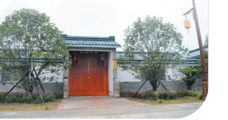
黄庄亮风荷韵民宿

来到金湖,不能不提万亩荷花荡。荷花荡新型农村社区位于省级旅游风情小镇——荷韵小镇境内,以“康养互补、旅游度假、产居融合”为定位,逐渐打造成生态宜居、宜业、宜商的新型农村社区。依托荷花荡景区这一热门观光“打卡”地,社区积极发展农家乐、民宿等旅游项目,以及荷藕等多个产业。这里有国内最大的线上、线下荷产品展销平台,定期开展金湖秧歌、莲湘舞、刺绣、打排拳、制香等非非遗项目展演,进一步留住和美乡愁、乡音、乡情。