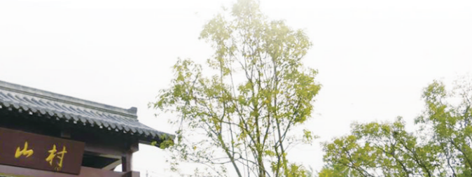
陡山村盛产红颜草莓