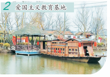
2 爱国主义教育基地