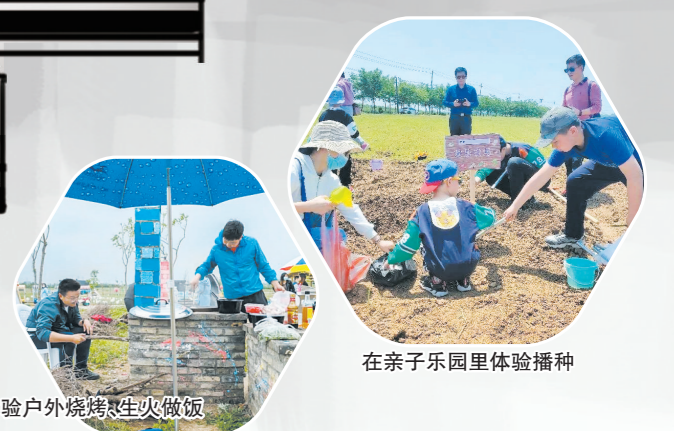
茶场可体验户外烧烤及篝火晚会

茶场始建于1958年,位于盱眙县城东南30公里处,毗邻长深高速公路和国家4A级景区铁山寺国家森林公园,山清水秀、交通便捷。茶场占地面积10900亩,有生态林2000余亩、茶园1860亩,是集茶叶栽培、生产、销售于一体的茶叶厂家,也是苏北地区规模最大、设备最齐全的茶商茶生产加工基地。近年来,茶场大力发展茶旅文化和农业休闲旅游,通过打造雨山亲子乐园,为特色田园乡村建设注入新活力,吸引大批游客前来游玩,年均旅游人数达10万人次。