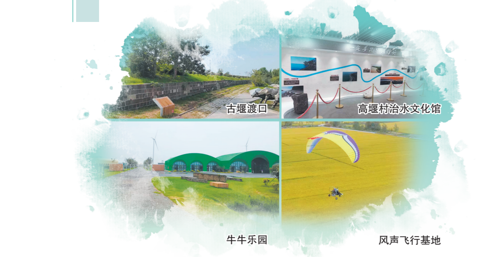
古堰遗址 高堰镇治水文化馆 牛牛乐园 风声飞行基地

在淮安城郊西南角、巍巍运河古堰旁，有一个古老村庄——高堰村，该村古色古香、风景宜人、农田、人居、古堰相辉映。高堰村保护性修缮古高堰（洪泽湖大堤）、镇水铁牛、乾隆御碑、石工墙等世界文化遗产，建设治水文化和高堰文化公园，开发古镇老街，成为大运河文化带重要节点。此外，围绕农旅融合、文旅融合，引进农业采摘体验和休闲体育项目，水稻谷、钓龙虾、乘滑翔机体验高空飞行、开山地越野车、骑马……诸项目丰富了游客体验，也带动了村庄旅游经济突飞猛进。