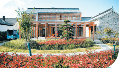
黄庄亮风荷韵餐厅