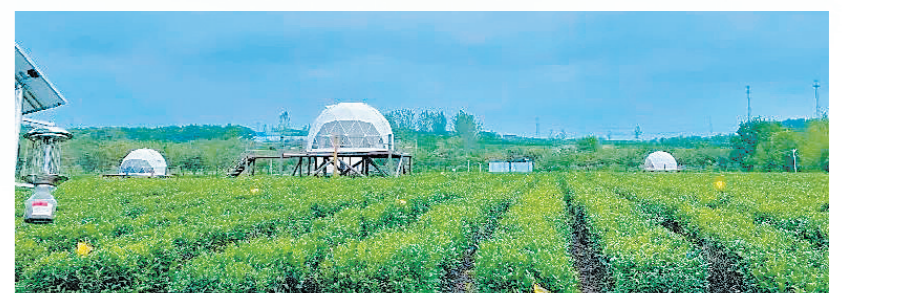
盱眙县黄花塘镇茶场

茶场始建于1958年,位于盱眙县城东南30公里处,毗邻长深高速公路和国家4A级景区铁山寺国家森林公园,山清水秀、交通便捷。茶场占地面积10900亩,有生态林2000余亩、茶园1860亩,是集茶叶栽培、生产、销售于一体的茶叶厂家,也是苏北地区规模最大、设备最齐全的茶商茶生产加工基地。近年来,茶场大力发展茶旅文化和农业休闲旅游,通过打造雨山亲子乐园,为特色田园乡村建设注入新活力,吸引大批游客前来游玩,年均旅游人数达10万人次。