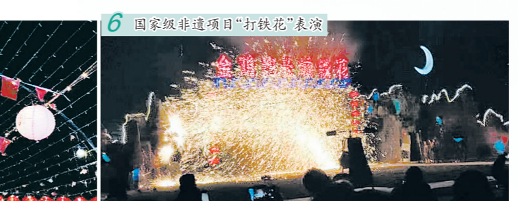
6 国家级非遗项目“打铁花”表演