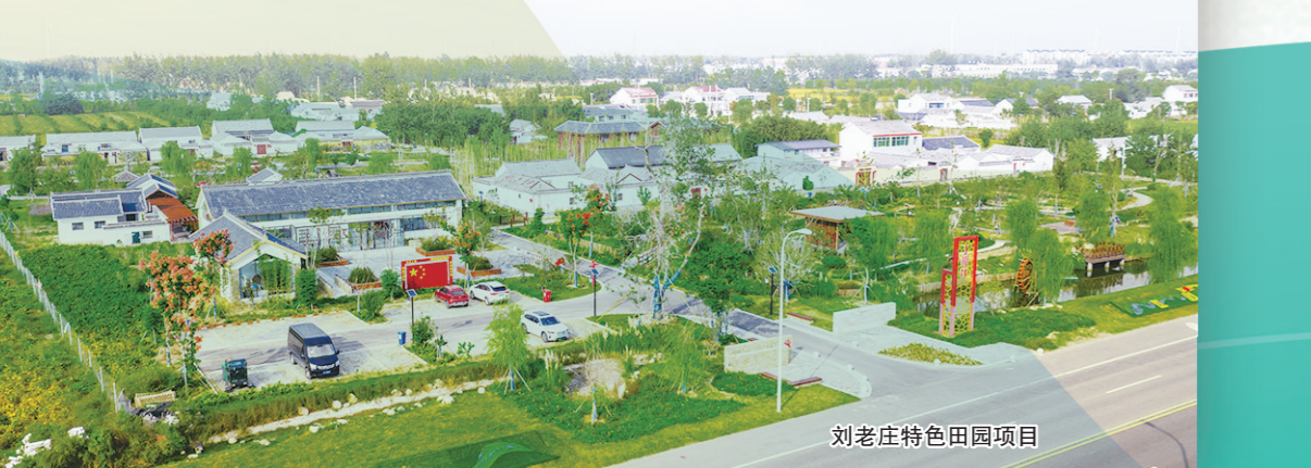
刘老庄特色田园项目