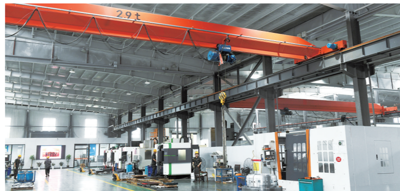
江苏金成机械科技有限公司