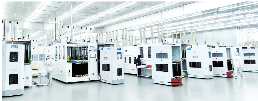
淮安捷泰新能源科技有限公司