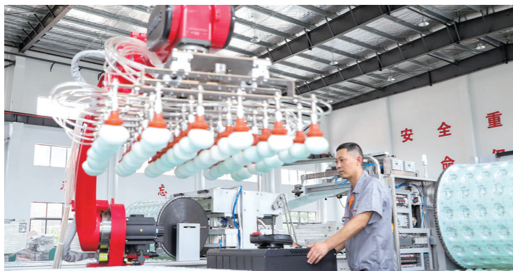
江苏鼎源食品机械制造有限公司