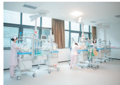
开诊首日,门急诊、病房、手术室等井然有序运行