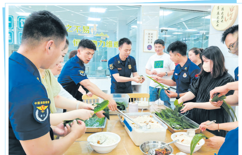
为推进“四项教育”走深走实,在端午节即将来临之际,淮安生态文旅区消防救援大队开展消防员家属开放日活动,邀请属地消防员家属来队,让消防员向家属报告履职情况,感谢家属们的默默支持和无私奉献。开放日当天,还开展了营区参观、座谈、包粽子、聚餐等活动,让家属近距离感受和体验消防员的工作和生活,充分发挥队属共建共建积极作用。 ■通讯员 陈雯

发挥德治作用,激发基层善治活力。深入学习贯彻党的二十大精神,开设“书记讲堂”“商圈微课堂”“指尖云课堂”等宣讲超160场次,推动党的创新理论落地生根。加快推进文明实践站点提档升级,打造健康路社区和曙光路金鸡品客文明实践样板站点。在抓好街道、社区16支志愿服务队伍的同时,积极整合辖区淮安八二医院、市全民健身中心等各方力量,不断壮大志愿服务队伍。今年以来,街道社区联合挂钩单位开展“幸福江苏淮安少儿健康行”各类文明实践活动120余场次,服务群众超过6000人。典型培育引领社会风尚,大力倡导学习典型争当先进活动,弘扬崇德向善新风,积极开展“身边的榜样 前行的力量”身边好人系列评选活动,让崇尚好人、学习好人、争当好人在淮海街道蔚然成风。