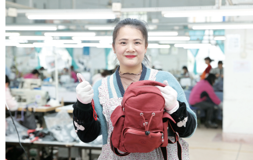
5月5日，淮安经济技术开发区一家企业的车间内，工人在赶制海外订单。近年来，我市出台一系列助企纾困和稳外贸措施，支持企业抢订单、拓市场。