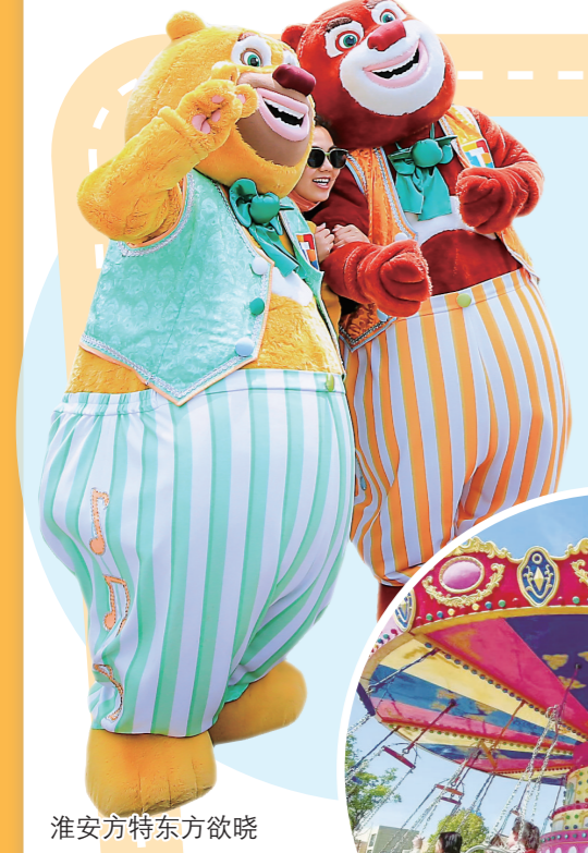
淮安方特东方欲晓

出看家本领——一品狮子头、迷你八宝葫芦鸭、灌汤鱼圆、乾隆九丝汤……一道道别具匠心的菜品尽显烹饪工艺。比赛期间还穿插了乐器独奏、淮海戏、扬剧等精彩节目,为观众带来美妙的视听享受,现场掌声不断。 最终,来自扬州的冶春和来自淮安的蒲园餐饮并列荣获大赛特金奖,花园国际、四时春获金奖,淮扬菜博物馆、栖凤餐饮、望潮楼获银奖,萃园城市、芳芳私房菜等8家单位获优胜奖。两地参赛选手表示,本次比赛既是擂台,也是名厨切磋交流的舞台,更是交流淮扬美食文化的平台。两地餐饮人将为弘扬淮扬美食工匠精神作出更大贡献。