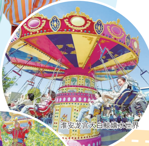
淮安龙宫太白鲸嬉水世界