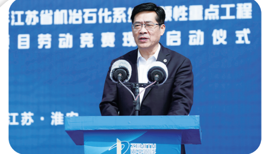
中天钢铁集团淮安新材料项目启动仪式现场，领导在台上发言。