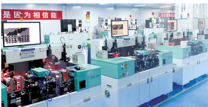
江苏国中芯半导体科技有限公司