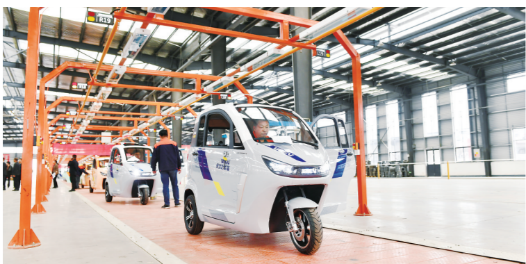
优米新能源(江苏)有限公司