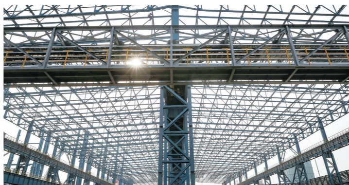
江苏沙钢集团淮钢特钢股份有限公司