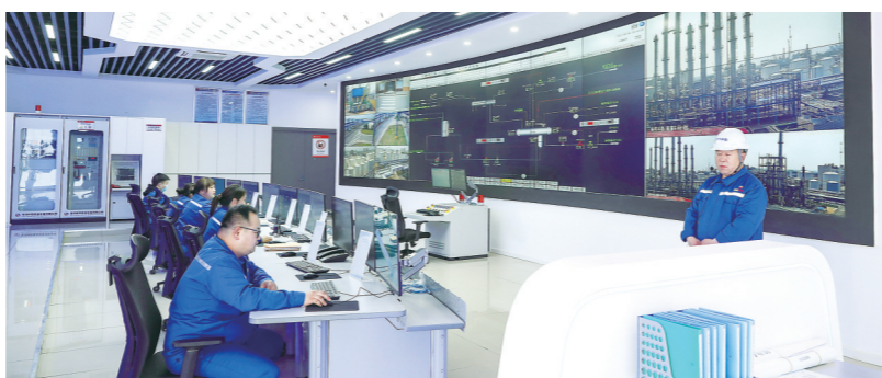
江苏翰祺中泰生物科技有限公司