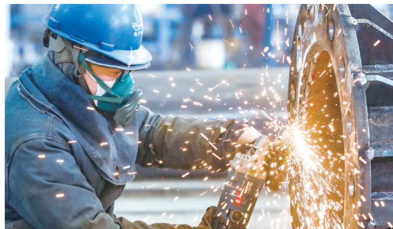
2月8日，江苏翔宇电力装备制造有限公司，工人在生产电力钢管塔。随着国内电力基础设施建设陆续开工，该公司订单不断增加，工人铆足干劲加紧生产，确保订单按时交付。融媒体记者 赵启瑞 通讯员 陈宇鹏

据介绍，一次性扩岗补助主要针对“招聘2022年度普通高校毕业生、离校两年内未就业普通高校毕业生和登记失业的16—24岁青年，签订一年以上劳动合同并参加失业保险”的企业，采取“免申即享”模式发放，企业每招聘1人补助1500元。